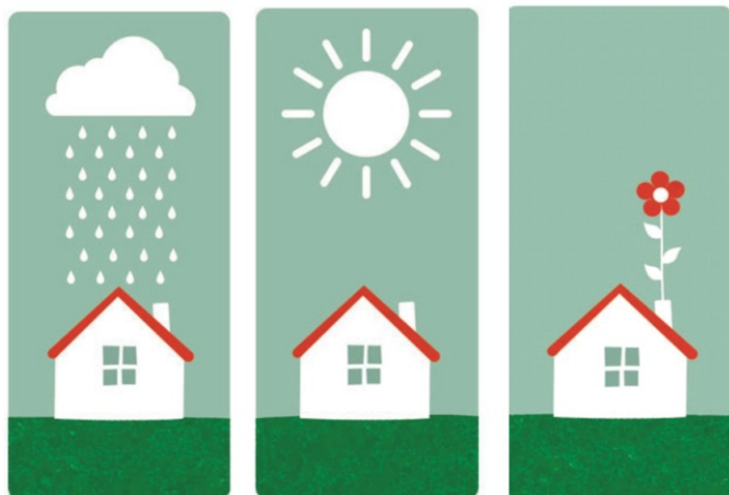
Ilustración de M a Reyes Guijarro.

Se ofrece una atención psicológica, tanto a víctimas como a agresores, donde se restituyan los procesos afectivos y relacionales fracturados y se puedan elaborar las experiencias de daño y trauma. El objetivo fundamental es reajustar la vida de la familia para que vuelva a ser funcional y sana.